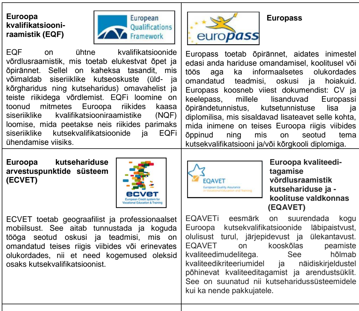
Joonis 1. Euroopa ühtsed meetmed

EQF ja EQAVET toimivad süsteemselt. Enamik riikidest tahavad 2012. aasta lõpuks siduda oma siseriiklikud kvalifikatsioonisüsteemid EQFiga, et kutseoskusi oleks üle-Euroopaliselt lihtsam tunnustada. Kvaliteedi tagamise toetamisega paneb EQAVET aluse kindlustundele ja usaldusele siseriiklike kutsekvalifikatsioonide ja nende rahvusvahelise võrreldavuse vastu läbi EQFi. Kvaliteedi parandamine suurendab kutsehariduse atraktiivsust.