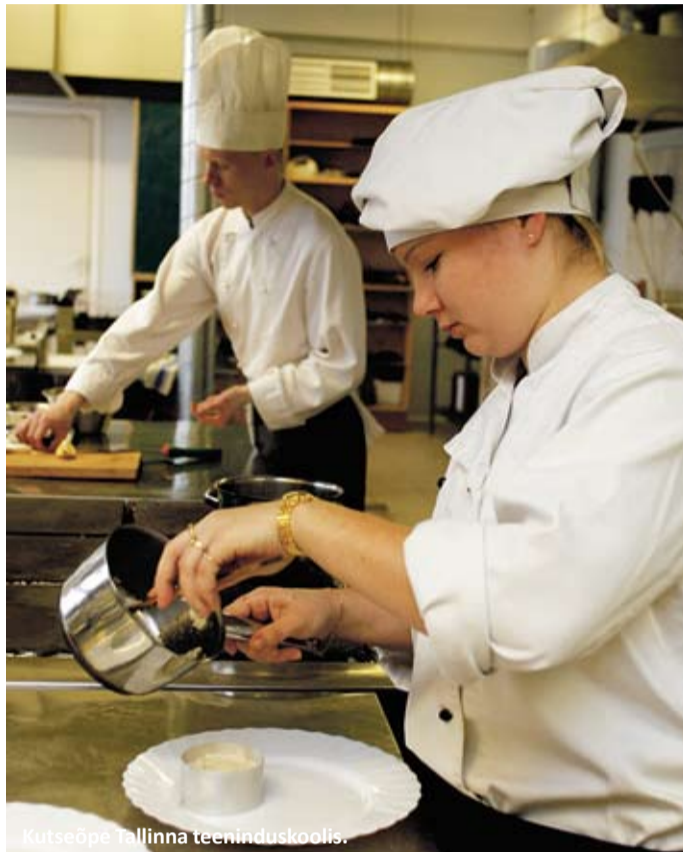
Kutseõpe Tallinna teeninduskoolis.

Viiimati detsembrikuus tegid ühildatud eksami maastikuehitajad, neist paaril jäigi kutsetunnistuse saamiseks punkte vajaka. Maastikuehitaja ühildatud kutseeksami koosneb teoreetilisest ja praktilisest osast. Et kooli lõpetada, tuleb teha mõlemad, kutsetunnistuse saamiseks läheb vaja vaid praktilist poolt. Praktilise tööga peavad tulevased maastikuehitajad oma oskusi eksamikomisjonile igati tõestama. Ööpäev varem saavad eksaminandid alusplaani lähteülesannetega.