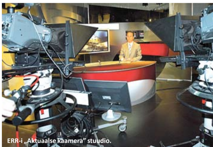
ERR-i „Aktuaalse kaamera“ stuudio.